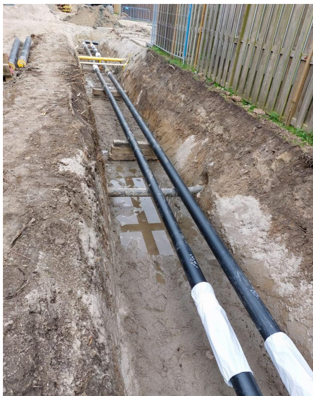
Aanleg Leidingen Stadsverwarming

De werkzaamheden van Vattenfall in de buitenruimte starten vanaf 10 januari op de Korendijk bij de Kwadrantwoningen. De werkzaamheden vinden voornamelijk in de straat en het openbaar groen plaats. Rondom uw woning zal er echter ook gegraven worden. Rijplaten zorgen ervoor dat uw woning te voet altijd goed bereikbaar blijft. Alle werkvakken worden afgeschermd met een hekwerk en er liggen rijplaten voor de hulpdiensten. Uw afval kunt u gewoon op de voor u gebruikelijke locatie aanbieden.