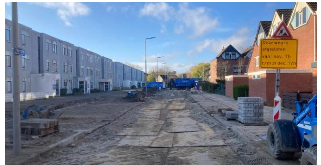
De tijdelijke bestrating van fase 9A en 9B van de straat Heindijk is vóór de kerstvakantie gereed.

In de periode tussen 24 december tot en met 9 januari (kerstvakantie) worden de werkzaamheden in de wijk Heindijk tijdelijk stilgelegd. De straten zijn dan zoveel mogelijk bereikbaar voor alle voetgangers en voertuigen. De werkzaamheden zullen na de kerstvakantie worden voortgezet.